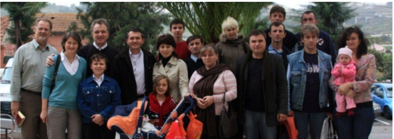
Gemeindebesuch in Lissabon, Portugal

Web: www.mbmsi.org und www.mbmsiVideo.org